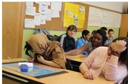
Colaflaschen-Attacke in der 4B

VON MARIA STERKL | 19. April 2011, 16:17