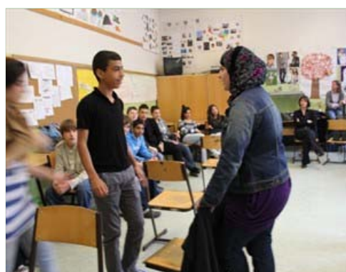
Rollenspiel: Frau mit "Kinderwagen"